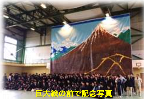
巨大絵の前で記念写真

平成30年度の庄農祭が、11月10日(土)～11日(日)両日、地域の方々の協力を得て、盛大に開催されました。今年のテーマは「Sh♡w 農time～光り輝く庄農祭～」