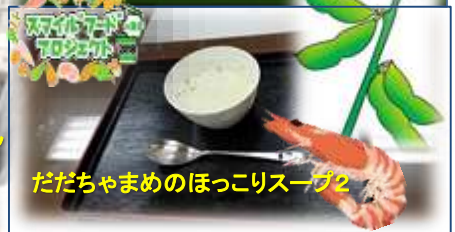
ただちやまめのほっこりスープ2

マルちゃんでおなじみの東洋水産株式会社が主催する「スマイル」フードプロジェクト in 東北 2018において、本校のチームほっこりⅡが出場130の応募の中から決勝大会出場6チームに選ばれ、山形県代表として参加してきました。