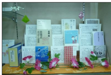
先生方がすすめる本を紹介するスペースもできました。