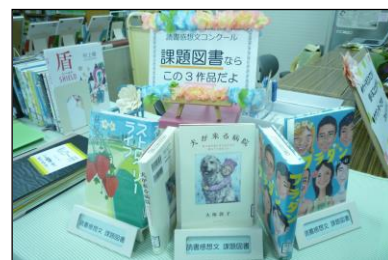
全国コンクール課題図書なら、読みやすく書きやすい！