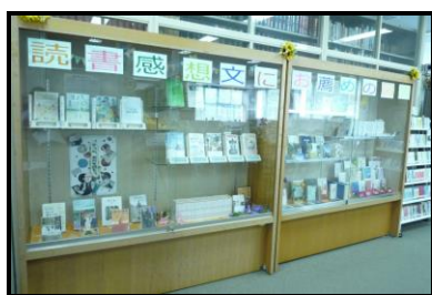
展示ケースの中は、「読書感想文におすすめの図書」コーナーに。