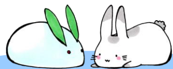
12月の各クラス館外貸出利用