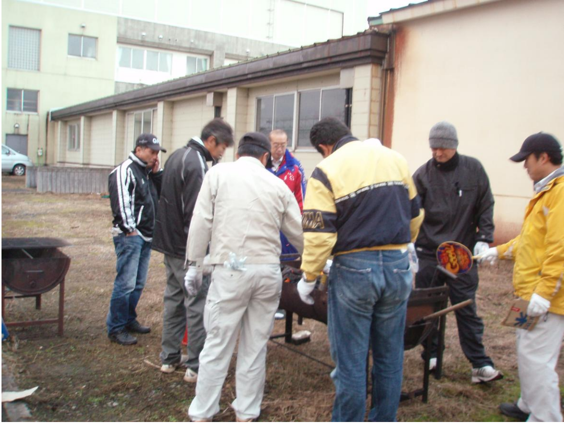
①朝6:30集合で火起こし