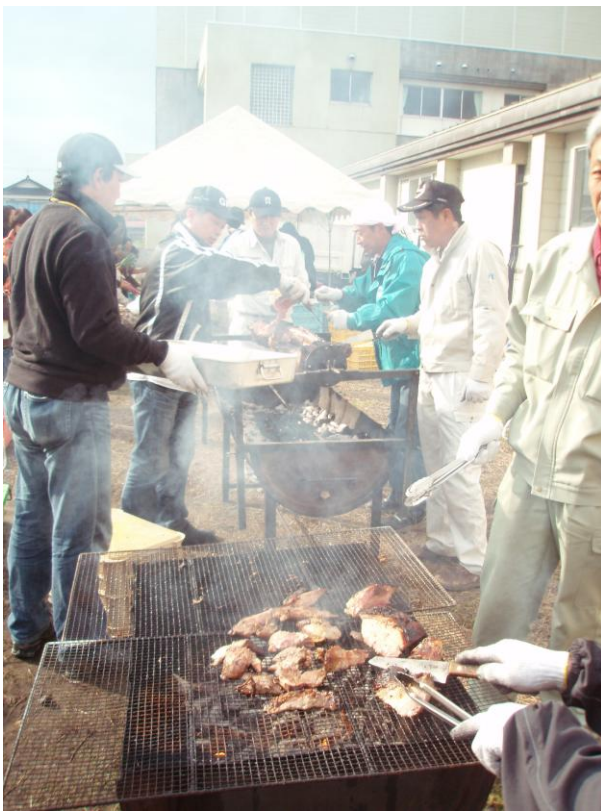
②火の通りの悪い所(ほとんど全部^^)は安全のために再度軽くあぶっているので安全です。