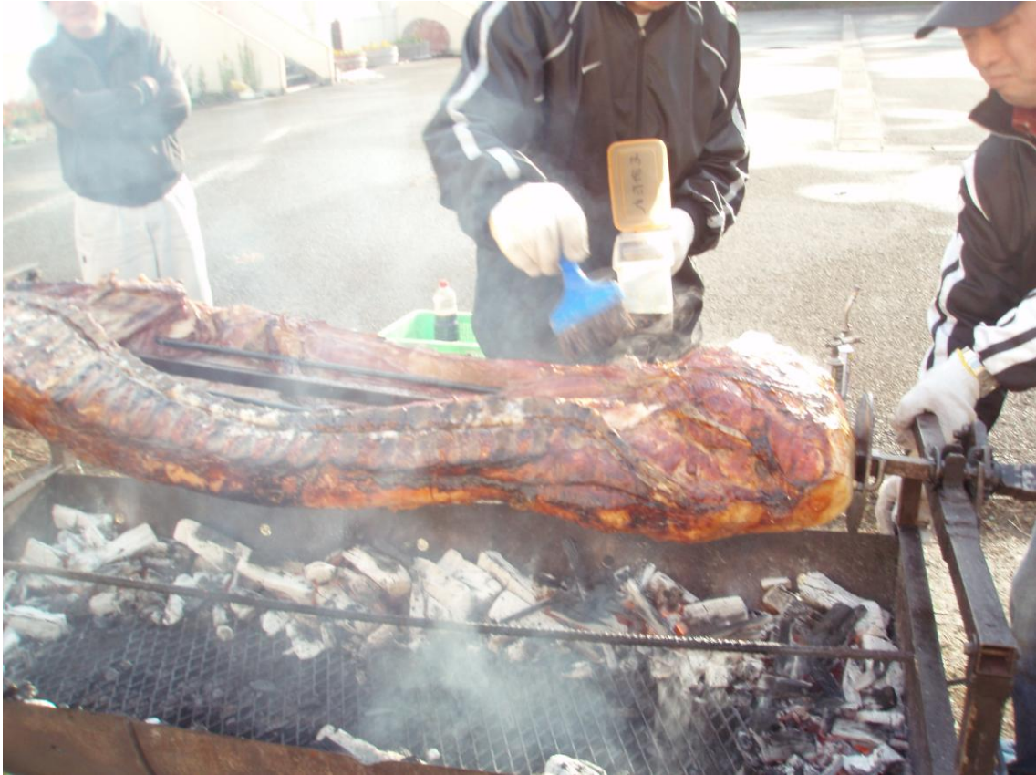
③適度に焼けたら「もみだれ」を塗ります。