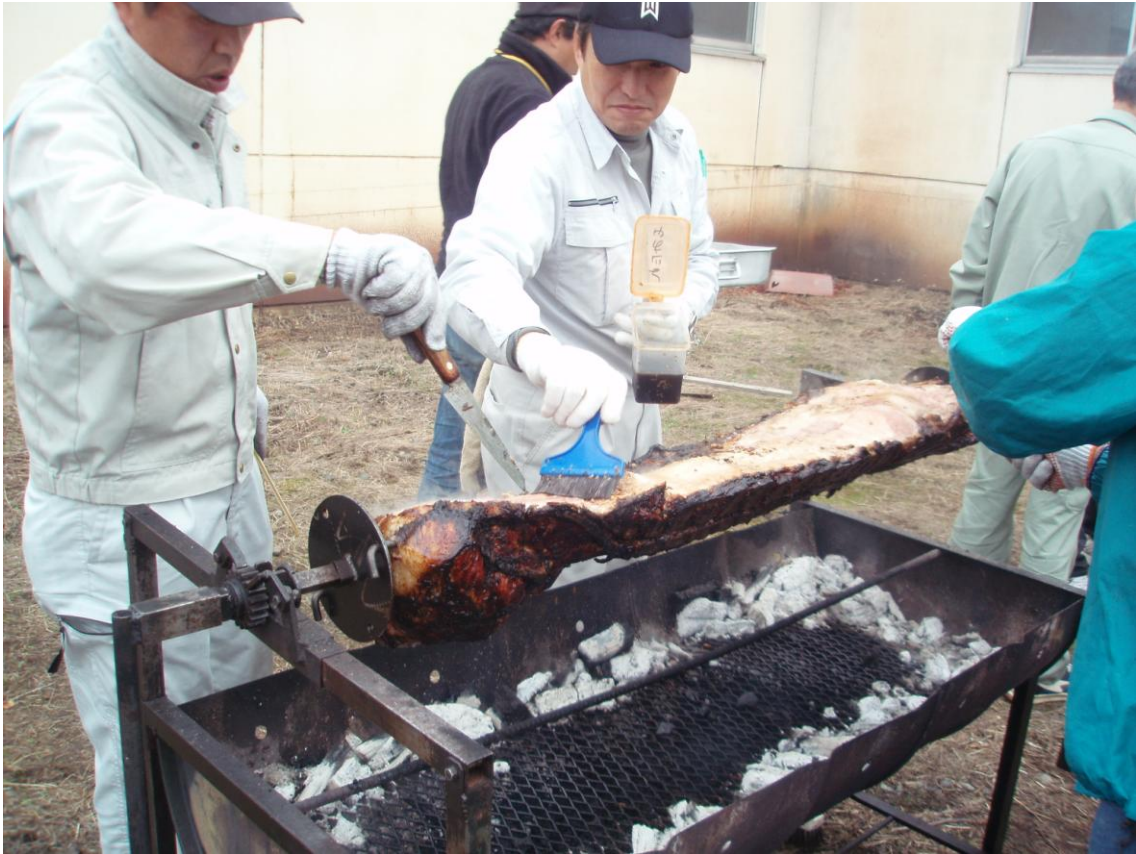
①だんだん骨が見えてきました。