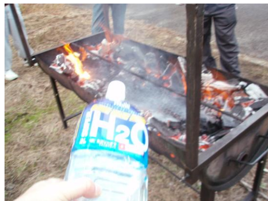
②炭は豚肉の真下に来ないようにずらす 直接焦げないように(燃えないように)するためです 火柱が上がったらペットボトルで炭に直接放水(キャップに穴が開いています)