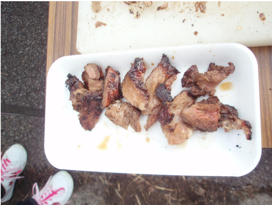
⑩販売した焼き豚肉、美味しかったです。販売制限しながらかなり早い時点で155食完売。 40kgの枝肉半身→15.5kg 肉・脂あるけど微妙に計算があわない?? 秤が怪しいとふんでますが、多少サービスもあったのかなと思っています。