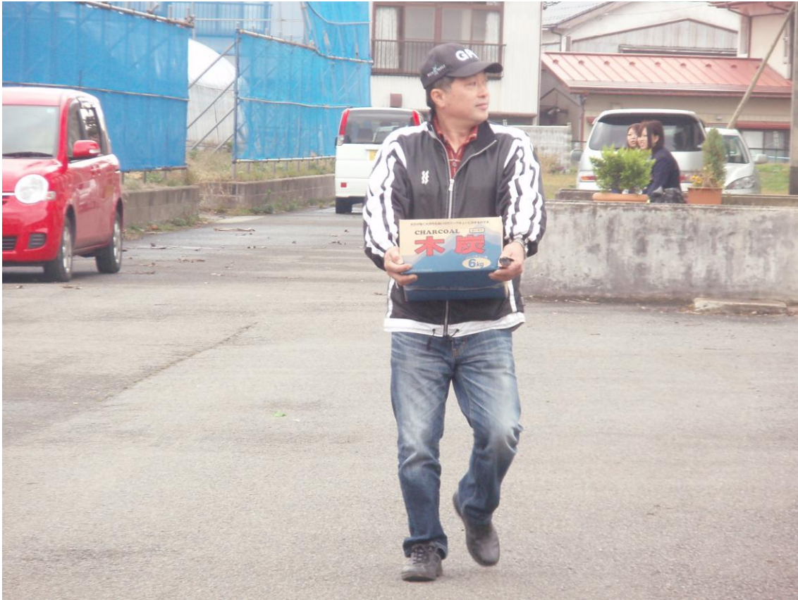
⑨途中で炭がなくなり、会長自ら買い出しに^^;