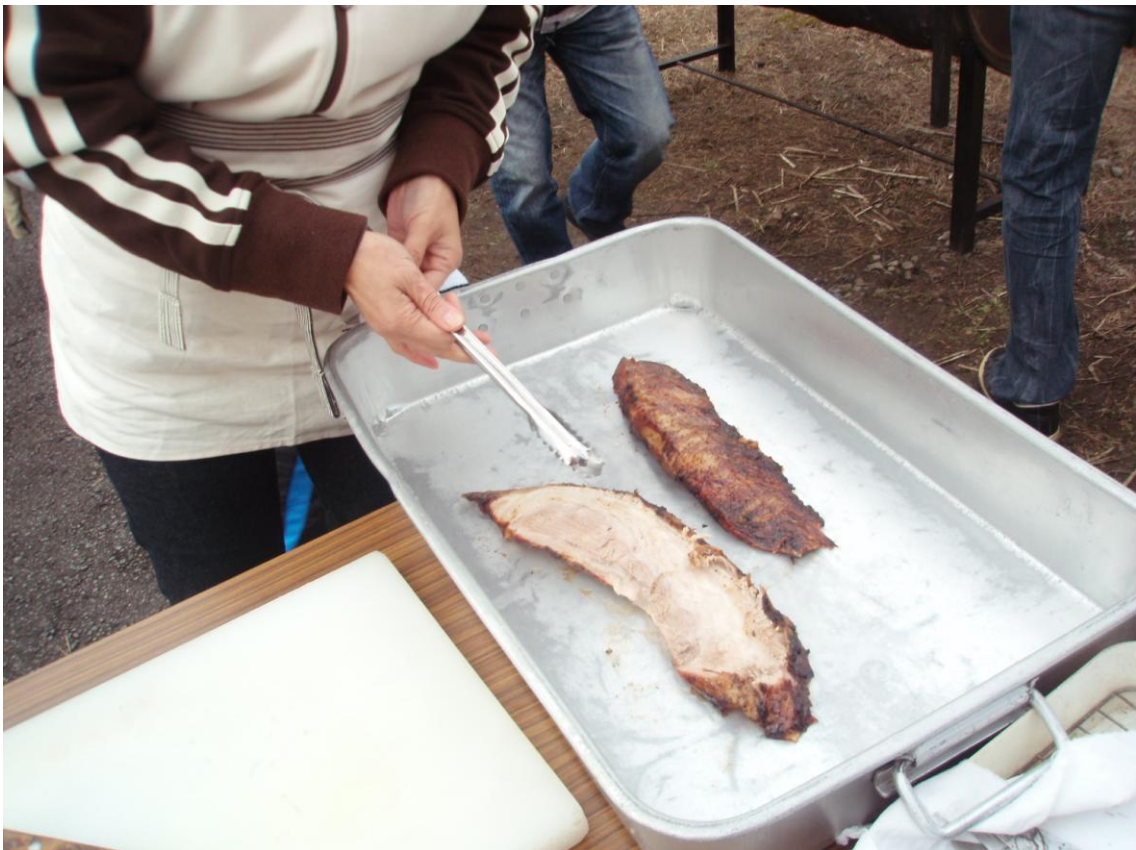
④肉切り包丁でステーキのように切ります(そぎ落とします)